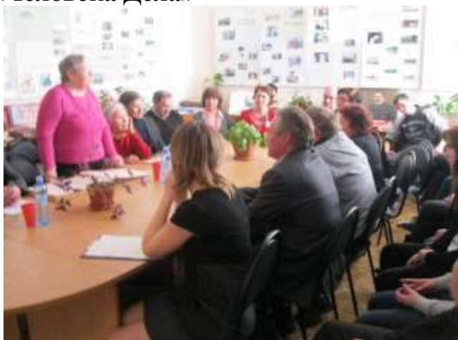
Круглый стол «Сердце отдаю детям...»