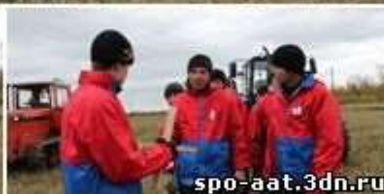
Расширенное заседание лаборатории «Педагогика Макаренко» 03.10.2013г